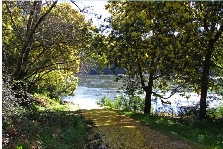
Embarcadero de Guláns