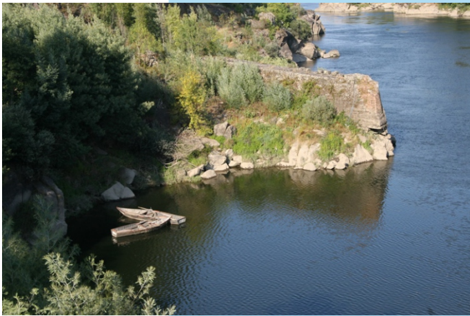
Pesqueira do Torno