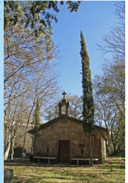
Carballeira e capela na área de lecer de Santa Mariña.