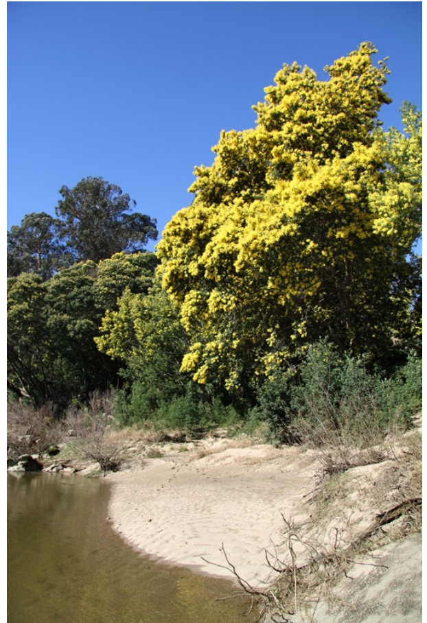
Praia de Guláns

Podemos comezar en Santa Mariña (Tortoreos), onde temos unha ampla área de lecer con boa sombra e amplo aparcamento; en Portomaior, onde hai outra área con mesas á sombra das mimosas ou en Guláns, a carón da praia. Desde Guláns pódese continuar camiñando río arriba 3 km máis ata Medáns aproveitando o camiño da Ruta do sol unha circular de 17 km que baixa desde Tortoreos a Santa Mariña, percorre o sendeiro dos pescadores e continúa ata Medáns para volver, polo interior, ao punto de partida.